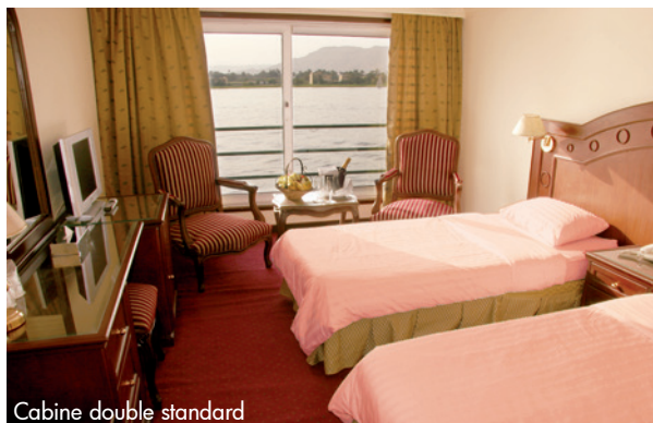
Cabine double standard