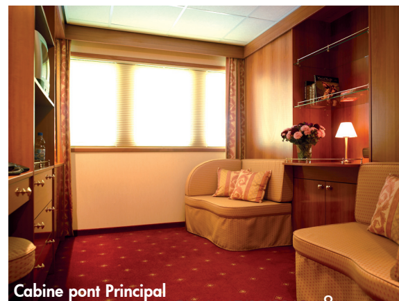
Cabine pont Principal