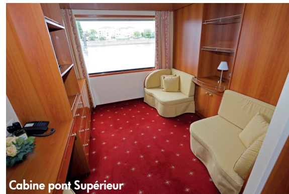
Cabine pont Supérieur

Les cabines sont réparties sur le Pont principal et le Pont Supérieur. Elles mesurent toutes 14 m 2 environ et sont éclairées par de grandes baies sur toute la largeur de la cabine, d'un seul tenant au Pont supérieur, divisées en trois au Pont principal. Leur aménagement et leur mobilier sont identiques. Elles sont toutes équipées de douche et WC, sèche cheveux, vanity kit, coffre-fort, TV, climatisation individuelle. Elles sont dotées de nombreux espaces de rangement et les lits, tous jumeaux, peuvent être transformés en coin salon pendant la journée.