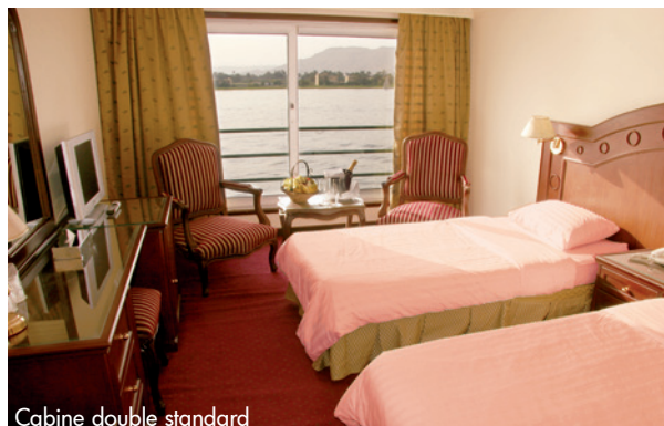
Cabine double standard