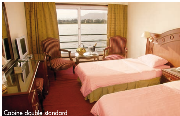
Cabine double standard