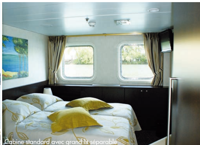
Cabine standard avec grand lit séparable